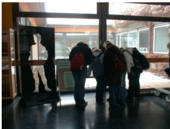
Interesse am Fehlenden Menschen in der Gesamtschule Mücke

solle auf den Umstand aufmerksam machen, Abstoß zum Innehalten geben und vielleicht sogar eine späte Trauer ermöglichen. Die Metallskulptur wird demnächst unter anderem in der Filiale der Sparkasse Vogelsbergkreis und auch an der Schule aufgestellt.