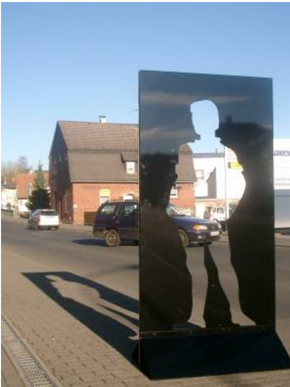
Der Fehlende Mensch in der Merlauer Straße in Nieder-Ohmen.

„Fehlende jüdische Menschen“ – so heißt das Projekt, das mit dem heutigen Gedenken für etwa drei bis vier Monate startet. Wir haben heute fehlender Menschen gedacht, Menschen, die Gesellschaft mitgestaltet hätten, ganz konkret das Dorfleben.