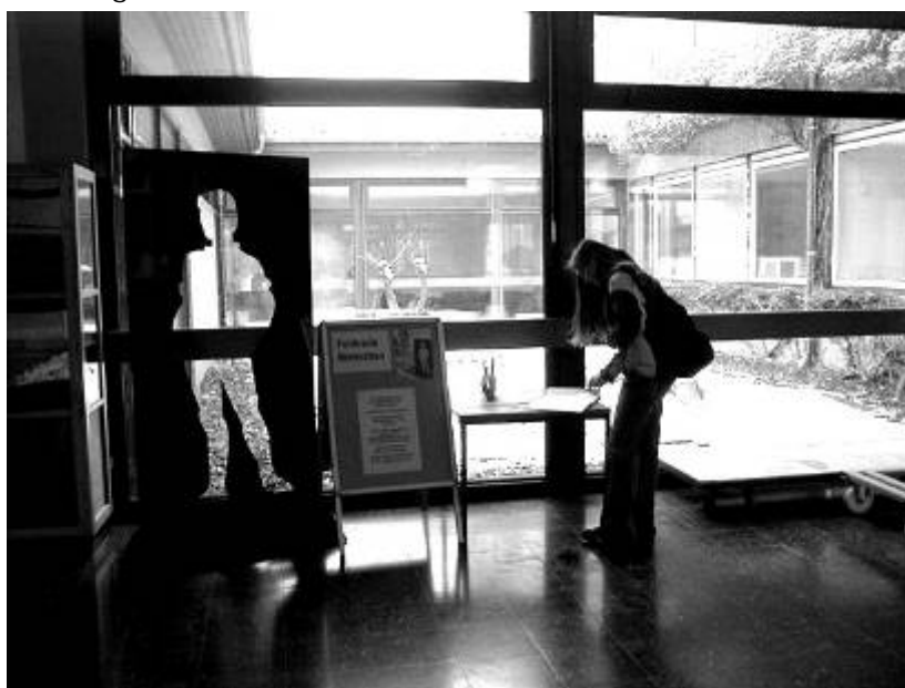
Der Fehlende Mensch in der Gesamtschule Mücke.

■ „Es ist schade, dass es so was gegeben hat. Ich setze mich selber für andere Menschen ein und helfe in der Kleiderkammer der Bereitschaft in ... aus. Da ich selber in der SEG bin. – n.n. – Ich bin selber Halbjüdin und komme aus ...“