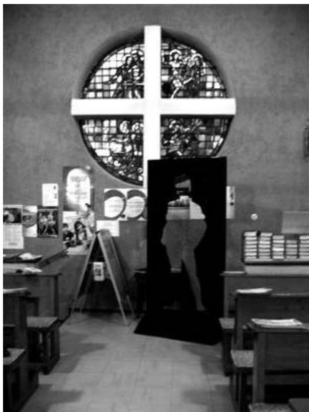
Der Fehlende Mensch in der Katholischen Kirche St. Johannes Evangelist, Mücke-Merlau.

Die Rechtschreibung wurde behutsam bearbeitet.