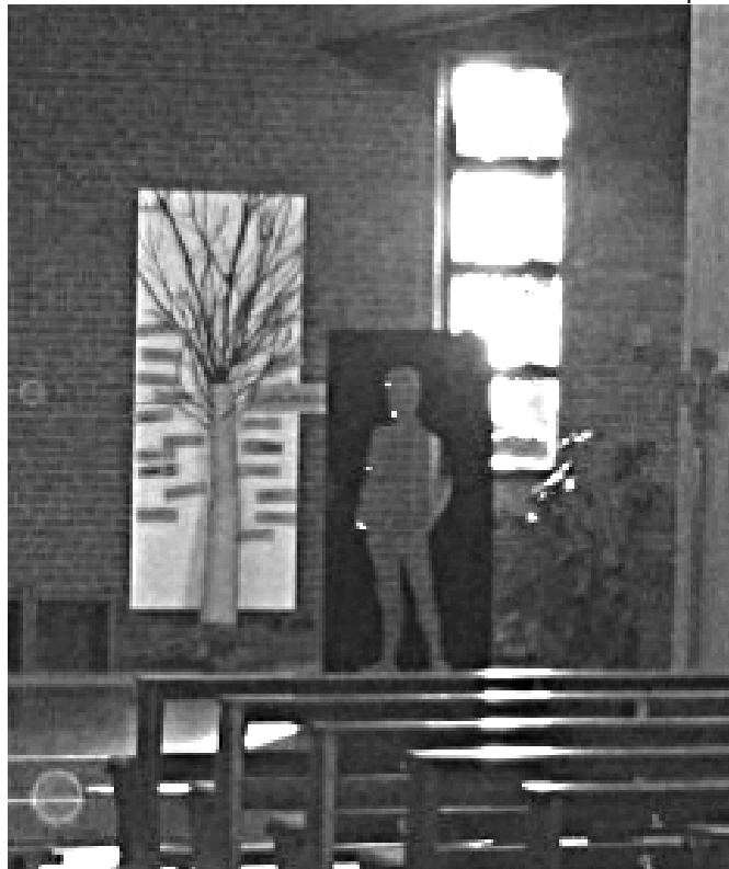
Der Fehlende Mensch im Altarraum der katholischen Kirche in Grünberg. – Nicht wenige Jüdinnen und Juden konvertierten im 19. und Anfang des 20. Jahrhunderts zum Christentum. Auch dies half ihnen später im Nazi-Terror nichts.

wird eine neue Lehre verkündet, so hat diese neue Lehre durchaus ihre Ursprünge in verschiedenen prophetischen Büchern. Und doch ist der Eindruck für die Menschen umwerfend neu. Wir dürfen es aus dem jüdisch – christlichen Hintergrund sagen, dass mit Jesus etwas Neues beginnt, ohne dass das alte überflüssig wird. Gerade wer trauert, weiß, dass fehlende Menschen nicht aufhören zu fehlen. Auch wenn ein langer Weg zurückgelegt worden ist, wird immer