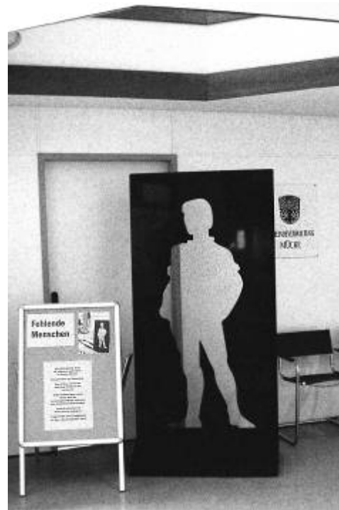
Der Fehlende Mensch in der Gemeindeverwaltung Mücke.

rung sei es der erste Schritt auf dem Weg zum Holocaust gewesen. Die brennenden Synagogen hätten letztlich zu den Gaskammern und Verbrennungsöfen von Auschwitz geführt. In diesem Jahr haben sich die Befreiung von Auschwitz und das Ende des Zweiten Weltkriegs zum 60. Mal gejährt, führte der Bürgermeister weiter aus. In diesen 60 Jahren habe sich in Deutschland vieles verändert. So sei es bereits 40 Jahre her, dass Israel und Westdeutschland diplomatische Beziehungen aufgenommen hätten. Vor 15 Jahren sei die Wiedervereinigung gekommen, ausgehend vom Fall der Mauer, am 9. November 1989. In den vergangenen 60 Jahren habe sich Deutschland zu einer stabilen Demokratie entwickelt und es habe sich dem dunkelsten Kapitel seiner Geschichte gestellt. Es gebe wieder jüdische Gemeinden, die viel zum religiösen und kulturellen Leben der Kommunen beitragen und es würden wieder neue Synagogen gebaut.