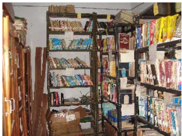
Die Bibliothek des Henry Baker College in ihrer derzeitigen Verfassung.