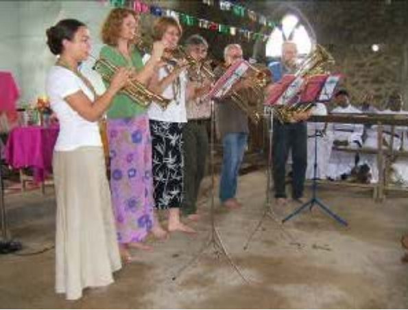
Bläser prägten den Partnerschaftsbesuch in East Kerala im Oktober 2005.

Einige Exemplare gibt es noch bei der Fachstelle Bildung und Ökumene, Alsfeld.