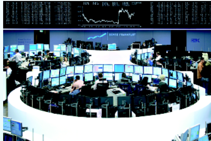
Ethik am Parkett: Was ist wichtig neben dem Verlauf der Börsenkurve?

GUT & BÖRSE. Die Finanzwelt beginnt, sich auf diese Entwicklung einzustellen. Eine Vielzahl von "nachhaltigen" oder "ethischen" Geldanlagen befindet sich inzwischen am Markt. Vereinzelt entstehen Kreditinstitute, die sich auf nachhaltige Geldanlagen spezialisieren. Denn der Markt wächst, gerade bei Privatanlegerinnen und -anlegern.