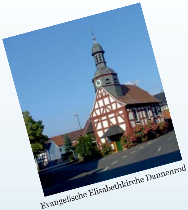
Evangelische Elisabethkirche Dannenrod

Im Jahr 1315 wurde Dannenrod zum ersten Mal genannt, 700 Jahre, ein Grund zum Feiern, das liegt auf der Hand.